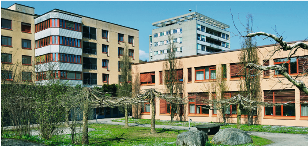
dahlia Wiedlisbach Bergstrasse 1, 4537 Wiedlisbach Tel. 032 636 56 56

Parkplätze stehen den Teilnehmenden in ausreichender Anzahl zur Verfügung.